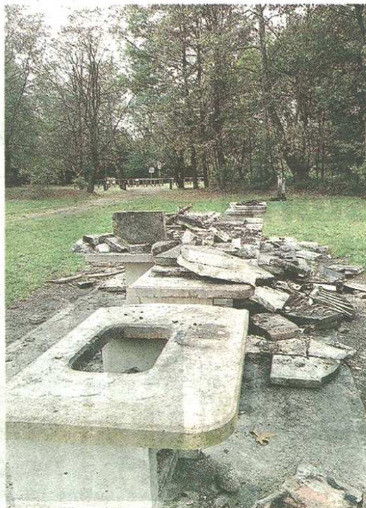
I barbecue vandalizzati per l'ennesima volta

La precedente gestione del Cda aveva infatti deliberato la demolizione dei barbecue fissi, ma non c'è ancora una decisione sul futuro di questo servizio offerto ai frequentatori del parco. Il rischio è che, una volta levate di mezzo le postazioni messe fuori uso dai vandali, non vengano più ripristinate analoghe strutture. Sarebbe un vero colpo per i frequentatori del Parco Altomilanese. «Non c'è dubbio che le griglie distrutte debbano essere tolte, perché non offrono una bella immagine, ma occorre pensare ad un'alternativa in vista dell'anno