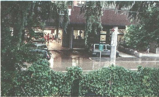
Via Bettinelli allagata: la gente continua a porre il problema ma non c'è soluzione (Blitz)

La gente è comprensibilmente esasperata: non capisce come mai tale problema continui a perpetuarsi senza soluzione: «Intanto - sbottano gli abitanti - noi dobbiamo continuare a subire danni e disagi». In via Giusti,