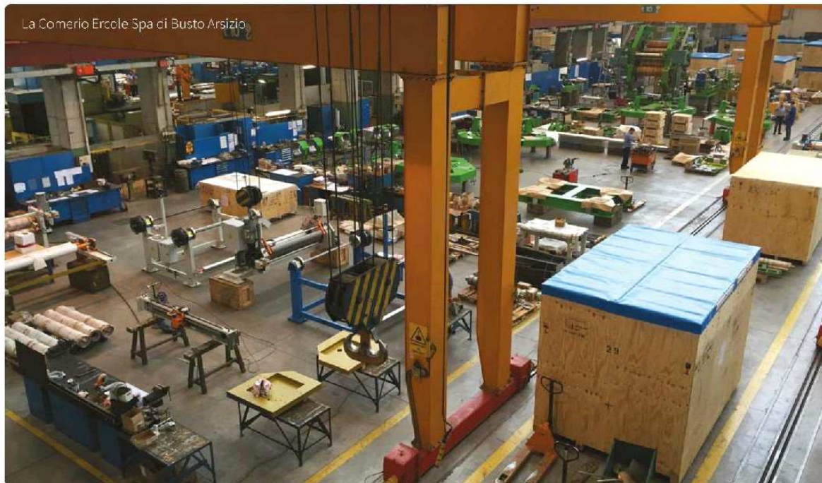
La Comerio Ercole Spa di Busto Arsizio

dotto, efficienza e tempestività del servizio di assistenza, capacità di elaborare progetti su misura per il cliente, capacità di fornire all'occorrenza una visione integrata di prodotto e di processo, oltre che focalizzazione estrema sul core business". A volte più delle statistiche a meglio descrivere la competitività del sistema produttivo è il racconto delle strategie delle imprese e le ragioni del loro successo. Dieci, ad esempio, le aziende tra il Varesotto e l'Alto Milanese analizzate da una ricerca svolta dall'Institute for Entrepreneurship and Competitiveness della LIUC – Università Cattaneo, insieme a Deloitte. Realtà, quelle studiate, scelte per la capacità dimo-