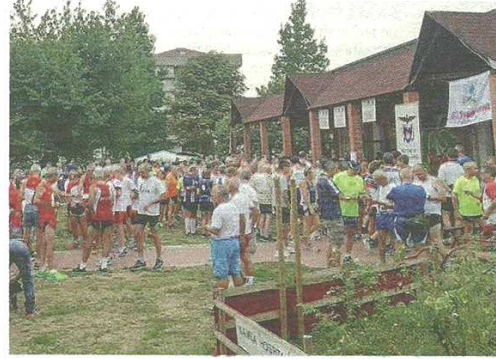
La partenza dei partecipanti alla Corte del ciliegio

pubblicato il 19/09/2016 a pag. 19; autore: Stefano Di Maria