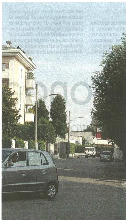
Attorno all'oratorio controlli contro la velocità (Bnlz)

pubblicato il 07/08/2018 a pag. 31; autore: Stefano Di Maria