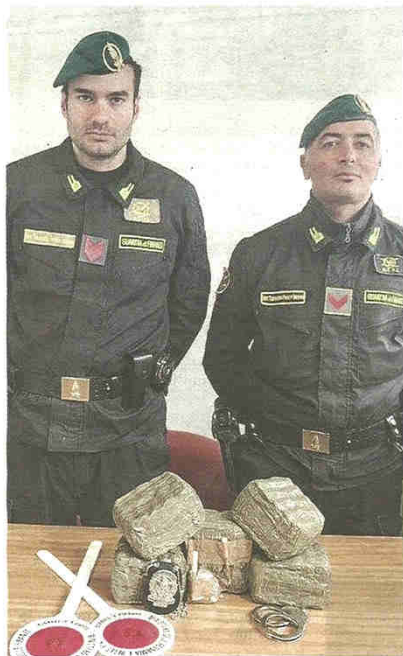
La droga sequestrata dalla guardia di finanza

pubblicato il 21/04/2018 a pag. 32; autore: Sarah Crespi