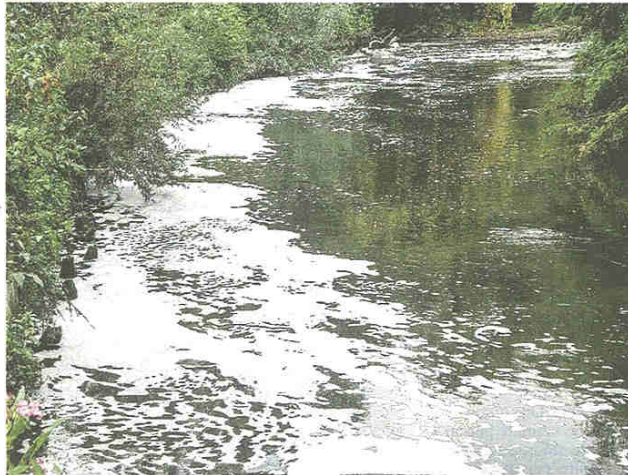
L'inquinamento del fiume Olona non diminuisce e Brumana va all'attacco

VALLE OLONA - Avanti come caterpillar, decisi ad abbattere tutto quello che potrebbe costituire un ostacolo alla bonifica del fiume. E così dopo aver denunciato Amsc, accusata di aver indebitamente trattenuto la quota della bollette dell'acqua, per legge destinata a finanziare gli interventi di adeguamento dei depuratori, adesso gli Amici dell'Olona chiedono l'intervento dei carabinieri forestali. Anzi, di più: invitano Regione Lombardia a stringere un accordo con i Forestali, così da promuovere una collaborazione a tutto campo per affrontare con strumenti finalmente efficaci problemi che si trascinano da troppo tempo. La fusione tra il Corpo forestale dello Stato e l'Arma dei carabinieri è cosa relativamente recente. Nell'Alto Milanese finora i carabinieri forestali (riconoscibili per la macchine di servizio verdi invece che nere) sono già intervenuti a Rescaldina per denunciare il proprietario di un bosco che aveva proceduto abusivamente al taglio di centinaia di albe-