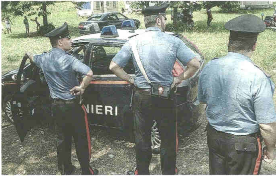
Oltre a far rispettare il divieto di grigliare, i carabinieri hanno stoppato la droga

CASTELLANZA - Nonostante il divieto di grigliare al parco Altomilanese, c'è stato anche chi ha sfidato l'ordinanza e si è diletto con il barbecue: ma gli è andata male, anche peggio del previsto. Perché nel ponte di Pasqua i carabinieri sono stati impegnati in un servizio straordinario proprio nel polmone verde preso d'assalto da chi è rimasto a casa. Hanno scoperto un gruppo di ragazzi intenti con costine e bracioline e sono subito intervenuti. Uno di loro, un diciottenne, si è dimostrato subito molto nervoso e così è stato sottoposto a un controllo più accurato: perquisito, è stato trovato in possesso di un coltello lungo 16 centimetri e di un lieve quantitativo di marijuana considerato per uso personale. Il giovane è stato denunciato. Stessa sorte per un pakistano venticinquenne disoccupato, pregiudicato e domiciliato a Busto Arsizio. Anche lui aveva deciso di trascorrere la festa al parco insieme agli amici connazionali, tutti sottoposti ad accertamenti: erano in quindici con una cinquantina di birre, quindi sono scattati i controlli per una questione di sicurezza. Il pakistano è risultato irregolare sul territorio italiano. Irregolare anche un serbo quarantacinquenne, anche lui finito sotto la lente di ingrandi-