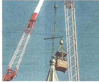
La croce staccata dal campanile con le gru (BHz)

L'allarme era scattato la sera della vigilia di Natale, quando le forti raffiche di vento avevano spazzato anche Castellanza, facendo traballare pericolosamente il crocifisso sul campanile, alto 82 metri. Il timore era che si staccasse da un momento all'altro, causando danni alla chiesa o alla casa parrocchiale,