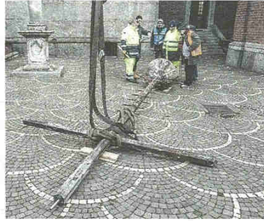
Deposto a terra il crocifisso, si è tirato il fiato (BHz)

ma anche all'abitazione del custode del Comune: per questo si era proceduto allo sgombero, chiudendo per precauzione le strade circostanti, in particolare corso Matteotti, e spostando le celebrazioni del Natale alla chiesa di San Bernardo a Castegnate.