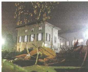
Buoni riscontri per l'iniziativa del Comune

occuperanno anche delle manutenzioni del verde pubblico e di attività di carattere ecologico: potranno infatti prendersi cura di giardini, aiuole e parchi. È in tutti questi