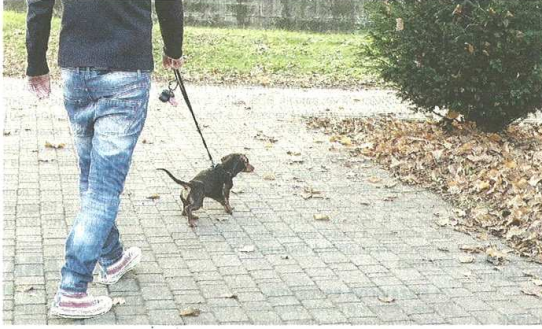
I frequentatori dei parchi chiedono spazi idonei per far passeggiare i cani

Pare che i vigili siano intervenuti su segnalazione di chi non vuole avere attorno cani, anche di grosse dimensioni, che possono ferire qualcuno (tanto più i bambini); senza contare il degrado provocato dagli escrementi. «Proprio al Parco dei Platani c'è un'area cani come quella del parco della Liuc» rimarca l'assessore