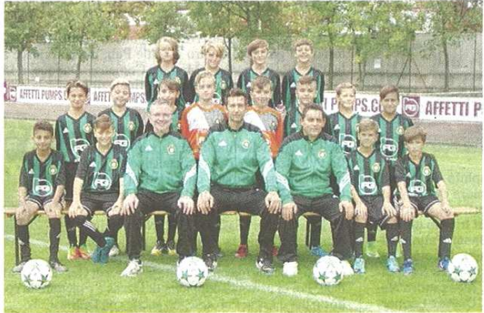
La formazione degli Esordienti 2006 della Castellanzese