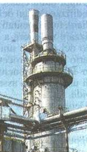
Ancora dibattiti sul polo chimico (Blitz)

il fabbisogno di energia termica ed elettrica del comprensorio industriale" senza specificare alcun valore»; contestano poi che «Chemisol parla di previsione di alimentare la rete di teleriscaldamento di Amga ma senza produrre alcun progetto di fattibilità e/o di accordi/impegni con Amga». Preme anche rimarcare che le perforazioni di circa 400 micropali, ubicati in gran parte in depositi di ceneri di pirite e in terreni potenzialmente contaminati, «potrebbero peggiorare il quadro ambientale trasferendo più in profondità la contaminazione dei suoli col rischio di compromettere la qualità delle acque di falda. Si tratta di definire se gli interventi previsti siano o meno compatibili con le attività di messa in sicurezza operativa del sito».