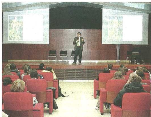
Un momento della lezione di ieri mattina a Palazzo pPrelli

MILANO - Oltre trecento studenti di cui molti provenienti dal Varesotto hanno partecipato ieri mattina a Palazzo Pirelli alla quarta giornata del progetto "Consiglieri per un giorno". Si tratta di una serie di percorsi di educazione alla legalità e alla democrazia riservati alle scuole secondarie di secondo grado promossi dal Consiglio regionale. Coinvolti gli istituti Facchinetti di Castellanza, Calvino di Rozzano, Milani di Meda, Gallini di Voghera Fiorini Pantani di Busto Arsizio, San Carlo di Milano e Marignoni di Milano.