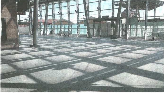
Ancora una volta è allarme sicurezza alla stazione delle Nord di Castellanza

ALLARME Violento borseggio ai danni di una donna. «Lo scalo non è sicuro»