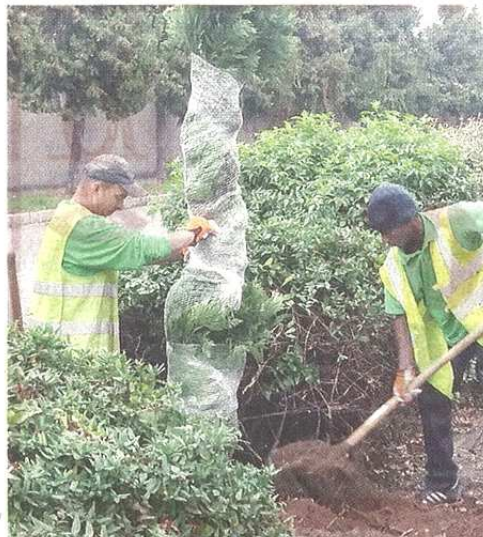
I cedri piantati a lato di corso Sempione

pubblicato il 07/11/2018 a pag. 30; autore: Stefano Di Maria