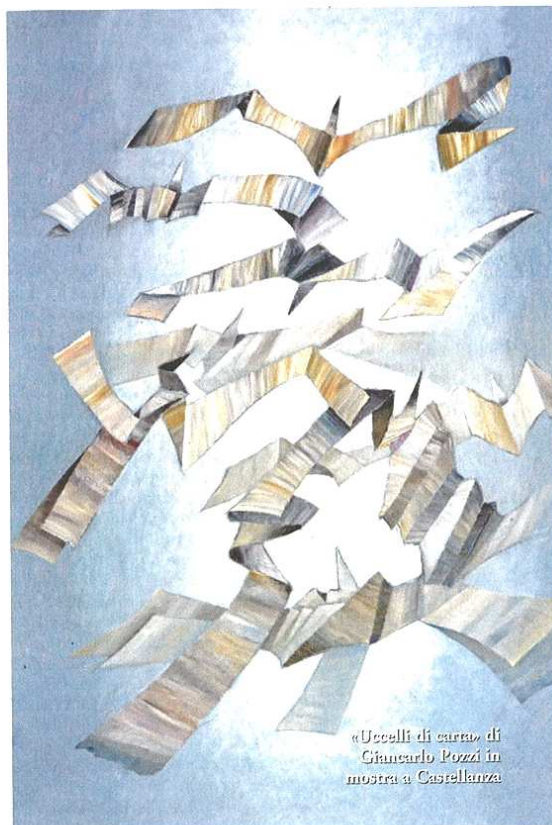
«Uccelli di carta» di Giancarlo Pozzi in mostra a Castellanza

Giancarlo Pozzi, «Come forme di luce...» - Castellanza, Villa Pomi, via Don Testori 14, inaugurazione sabato 1° dicembre alle ore 16, fino 6 gennaio venerdì e sabato ore 15-19, domenica 10-12,30 e 15-19, ingresso libero, info 0331 526263; catalogo in mostra.