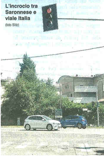
L'incrocio tra Saronnese e viale Italia