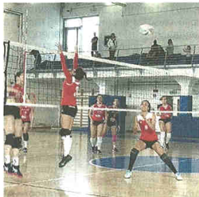
Una fase di gioco di Insubria-Cislano

D FEMMINILE - GIRONE C Biglietti porta Cassano alla vittoria su una Futura Giovani grintosa