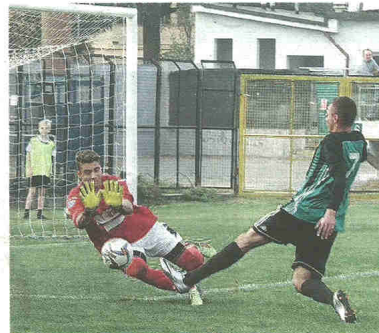
Cotardo esce alla disperata su Pedergrana

Nei primi minuti eravamo rinunciari, poi siamo cresciuti imponendo ritmo e gioco