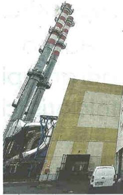
L'inceneritore di Borsano rimane nel mirino dei Comuni

pubblicato il 27/10/2018 a pag. 36; autore: Carlo Colombo