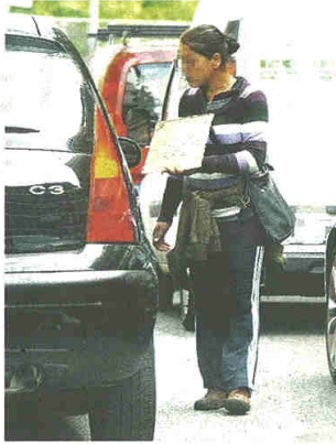
I carabinieri hanno ideato controlli mirati

In particolare, sono stati denunciati per essere presenti in Italia in modo irregolare un nigeriano di 25 anni; un ventenne e un diciottenne originari della Tunisia, anche loro senza fissa dimora ma con alle spalle già qualche guaio con la giustizia; una donna di quarant'anni originaria di El Salvador, che risulta domiciliata a Legnano; infine, un im-