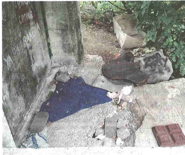
Il giaciglio improvvisato che accoglie qualcuno la notte

pubblicato il 27/10/2018 a pag. 31; autore: Stefano Di Maria