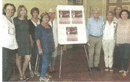
La presentazione degli incontri del 4 e 25 ottobre

pubblicato il 25/09/2018 a pag. 30; autore: Lucia Landoni