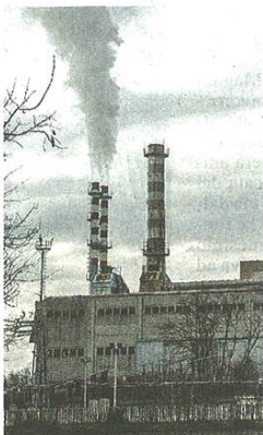
I camini di Accam. In alto, la seduta consiliare di lunedì