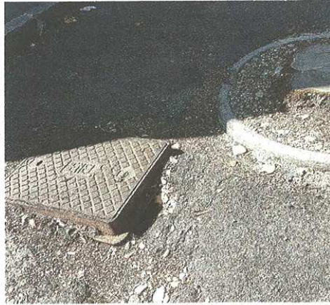
Il tombino killer di viale Lombardia

pubblicato il 04/08/2019 a pag. 29; autore: Stefano Di Maria