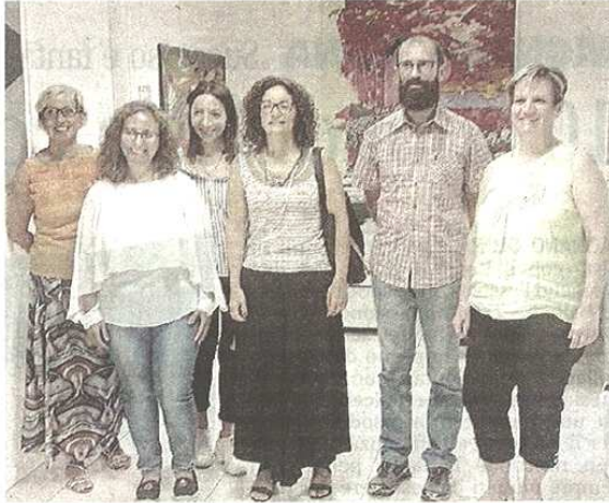
La presentazione delle due proposte per le famiglie