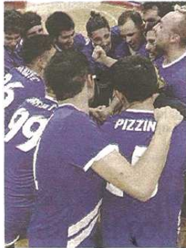
L'esultanza degli azzurri dopo la conquista dell'Europeo

(pmu) Da ieri, giovedì 8 sino a domenica 11 agosto, la Malesia sarà la capitale mondiale del tchoukball.