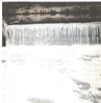
La schiuma sull'Olona all'altezza di uno dei salti del fiume nel comune di Fagnano Olona

(pil) Grazie ai sensori sugli scolmatori il fiume Olona sarà più sicuro contro gli sversamenti.