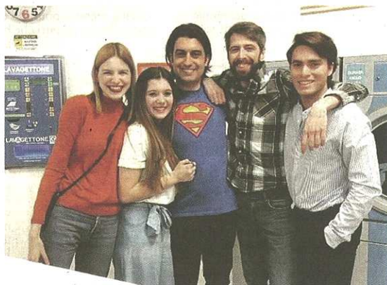
Alcune fotografie dei ragazzi che lavorano alla Nuova Accademia Cinema di Legnano. Da oggi a Castellanza

pubblicato il 15/04/2019 a pag. 17; autore: Stefano Di Maria