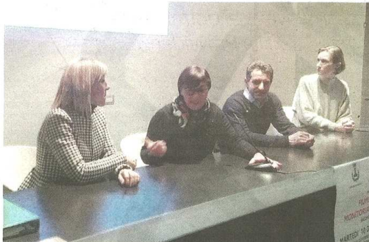
Il progetto è stato illustrato ai cittadini in biblioteca: collabora anche il Politecnico