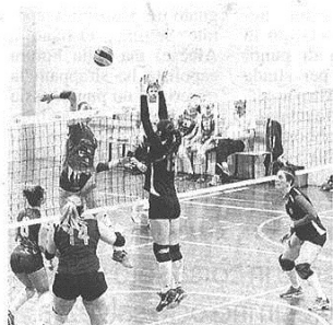
Una fase di gioco di Rho-Kolbe Legnano

D FEMMINILE - GIRONE C Rho a segno nella sfida con la Kolbe, Insubria ok con Cisliano