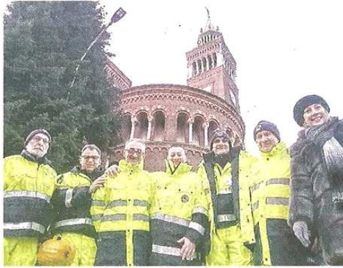
Il gruppo di Protezione civile cerca volti nuovi

CASTELLANZA - Bilancio molto positivo per l'ultimo anno di attività della Protezione civile, che si è distinta ancora una volta per gli interventi di emergenza e tutela della popolazione. Due gli allagamenti in piazza Castegnate affrontati mettendo in atto il pompaggio dell'acqua che aveva invaso la strada e presidiando i punti dove non potevano passare auto e persone; 2 gli interventi per caduta di alberi, tagliati a pezzi e rimossi dalla carreggiata; 4 le esercitazioni comunali e sovracomunali, finalizzate ad acquisire le migliori capacità pratiche per gestire le emergenze; 6 le prove di evacuazione di plessi scolastici e di addestramento degli alunni delle due scuole elementari e medie e 3 le prove di accompagnamento; un intervento di ricerca persone a Marnate (concordato con le forze dell'ordine), quando si era smarrito un pensionato facendo scaturire ricerche prolungate in Valle; 10 collaborazioni a manifestazioni pubbliche (sagre, Carnevale e notte bianca), di supporto alla polizia locale e ad altre forze dell'ordine.