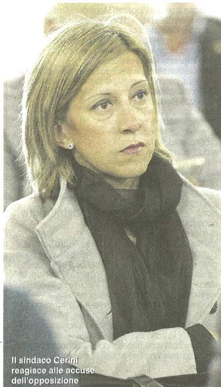
Il sindaco Cerini reagisce alle accuse dell'opposizione

Stefano Di Maria © RIPRODUZIONE RISERVATA