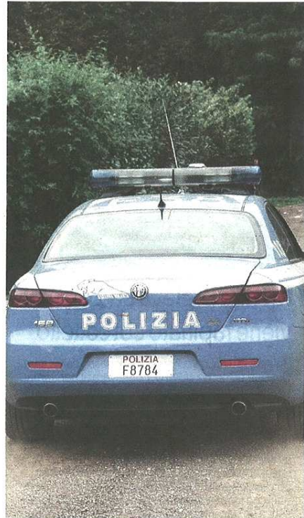
Fine settimana di controlli nei boschi del Rugareto

pubblicato il 15/01/2019 a pag. 28; autore: Luigi Crespi