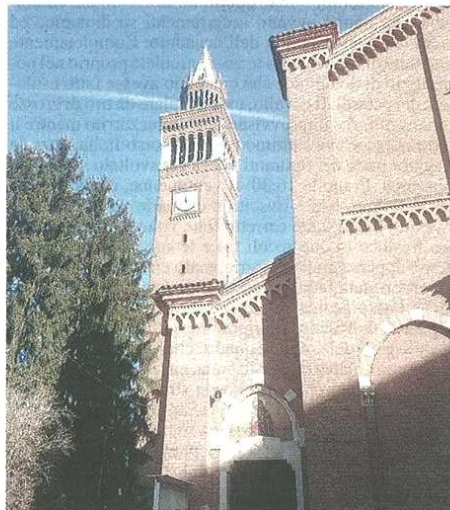
L'imponente croce del crocifisso di San Giulio ha rischiato di cadere nel giorno della Vigilia

pubblicato il 15/01/2019 a pag. 29; autore: Stefano Di Maria