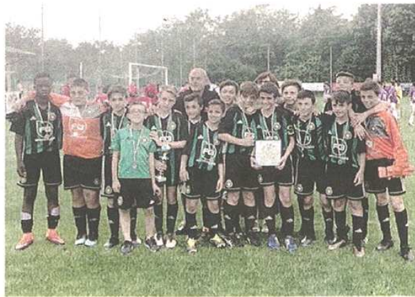
I giovani calciatori della squadra bianca della Castellanzese 2007

OLGIATE OLONA (pil) La squadra bianca della Castellanzese 2007 si aggiudica il memorial «Simone Colombo» disputato lo scorso weekend. Quella di domenica è stata una grande giornata di sport e divertimento al campo sportivo di Olgiate Olona, casa dei Leoncini.