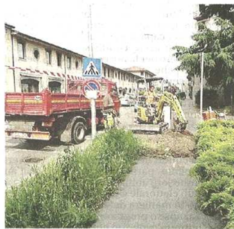
I lavori di messa in sicurezza a Castellanza

pubblicato il 14/06/2019 a pag. 49; autore: dtm