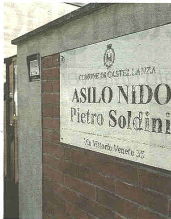
Giovedì pomeriggio si terrà un presidio

Si contestano poi «la qualità di cura dei bambini e la svendita di professionalità e