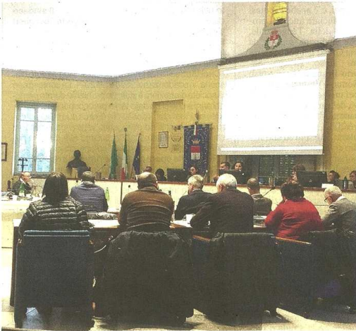
L'assemblea dei soci Accam era stata già convocata ieri pomeriggio per altre questioni, l'attenzione si è spostata sulla vicenda aperta dal pronunciamento della Corte dei Conti. Presto si terranno altri confronti fra i comuni interessati

Francesco Inguscio © RIPRODUZIONE RISERVATA