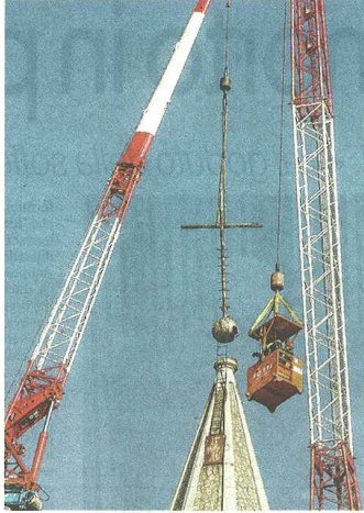
La rimozione della croce avvenuta tre mesi fa (Bnl)

Di un impianto audio c'era un gran bisogno nella chiesa di San Giulio, dove la situazione era tale che durante le messe non si sentiva la