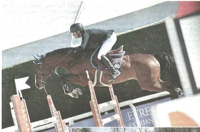
Seicento cavalli al secondo appuntamento del "Milano Jumping Challenge" a Gorla