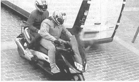
I due rapinatori ripresi in un video dei carabinieri di Verbania

Armati di taser entravano in azioni dove c'era una sola commessa