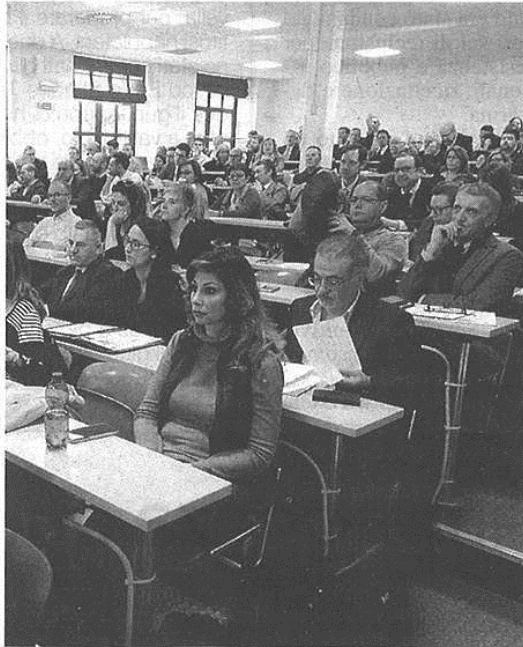
Aula piena ieri alla Liuc per l'incontro sulla riforma del terzo settore, ancora tutta da capire nel dettaglio

Perciò, l'associazione Liuc Alunni, che raccoglie i laureati dell'ateneo castellanese, volendo organizzare un incontro pubblico a tema giurisprudenziale, ha consultato i propri soci ed è emerso che, dopo la riforma fallimentare, ancora in fase embrionale, quella del terzo settore era la più gettonata. Così è nato l'incontro di ieri, introdotto dalla presiden-