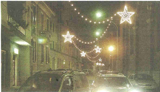
Il Comune è costretto a tirare la cinghia sulle luminarie nel centro cittadino

Lo stanziamento è modesto ma i commercianti capiscono: «Metteremo del nostro»