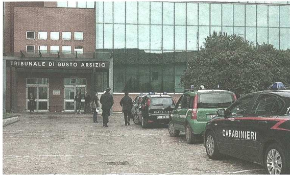
Ieri la sentenza in Tribunale a Busto nei confronti di un rapinatore specializzato in market

CASTELLANZA - Con la sua folta capigliatura riccioluta non poteva passare inosservato. Di rapina in rapina, i testimoni ricordavano un boccio sfuggito dal cappellino, piuttosto che dal passamontagna. E quando venne arrestato in quasi flagranza fu facile ricondurre a lui altri due colpi messi a segno nei giorni precedenti. Ieri mattina il giovane albanese è stato condannato dal gup Tiziana Landoni a una pena di quattro anni e quattro mesi, il pubblico ministero Massimo De Filippo aveva chiesto quattro mesi in più. Il colmo è che il ventitreenne assaltava i market per autofinanziarsi il rimpatrio in Albania, ovviamente tornandoci non da poveraccio ma con un po' di soldi in tasca. Il ragazzo era già affidato in prova ai servizi sociali a