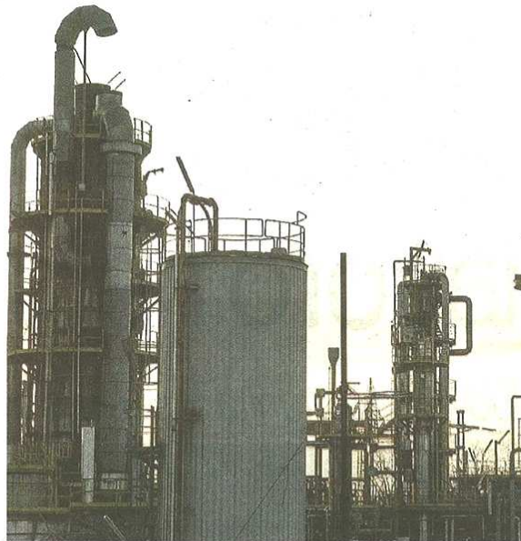
Il dibattito sul futuro del polo chimico continua. Ora si fa chiarezza su cosa non potrà essere inserito in quell'area già penalizzata (Blitz)

Stefano Di Maria © RIPRODUZIONE RISERVATA