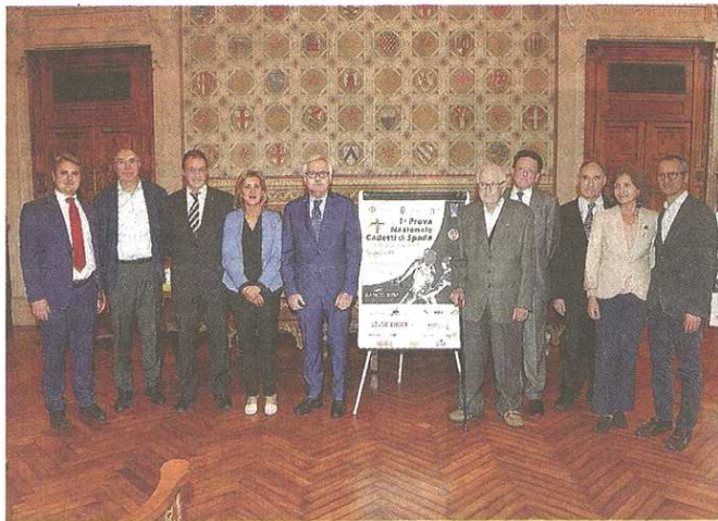
Ieri è stata presentata a Legnano la prima prova nazionale Cadetti di spada

La manifestazione organizzata dal CS Legnano vedrà confrontarsi in pedana quasi 800 giovani talenti