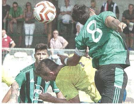
Roncari vuole una Castellanzese da battaglia

pubblicato il 14/09/2019 a pag. 37; autore: Guido Ferraro