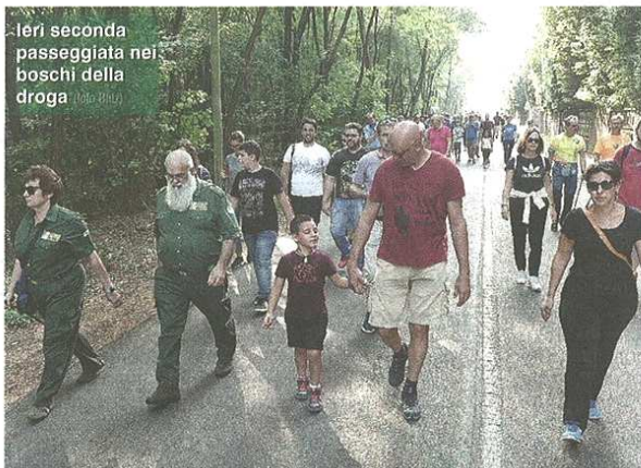
Ieri seconda passeggiata nei boschi della droga