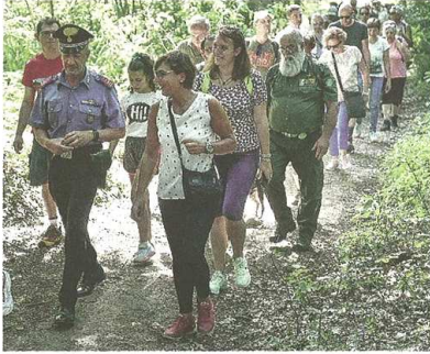
Dopo l'arresto del pusher, oggi torna la passeggiata anti-droga

Secondo le forze dell'ordine si tratta di uno dei pusher dei boschi, fenomeno noto ma in calo