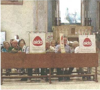
La celebrazione nella chiesa di San Giulio