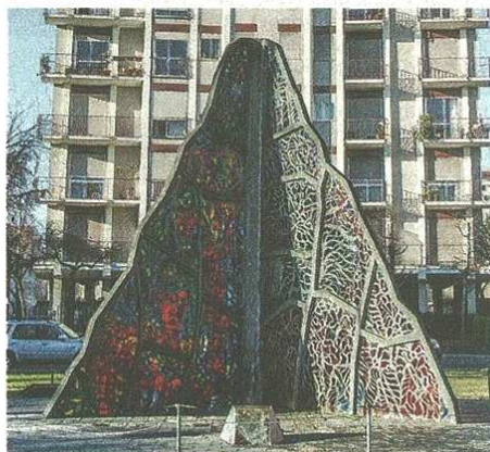
Nel parco di via Cantoni la notte si segnalano presenze non gradite. Qui sopra, il monumento