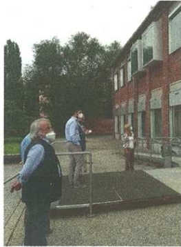
Il sopralluogo nei punti che dovranno affrontare alcune innovazioni per i punti luce