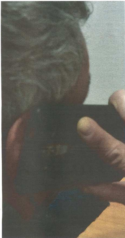
Un truffatore intrattiene al telefono la vittima a lungo, un complice si presenta alla porta per ritirare i soldi

CASTELLANZA Tre colpi a segno. Uno sventato al telefono