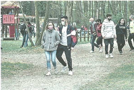
Il Parco Altomilanese si estende nei comuni di Busto Arsizio, Castellanza e Legnano

Sempre più sicuro il Parco Altomilanese, la vasta area verde che si estende nei comuni di Busto Arsizio, Castellanza e Legnano. Negli ultimi anni sono stati fatti interventi importanti per migliorarlo, tra le situazioni da contrastare i vandalismi e l'abbandono incivile di rifiuti. E su questo fronte c'è una novità: è infatti attiva l'App dedicata, si tratta di un'applicazione per segnalare in modo tempestivo vandalismi, scarichi abusivi e ogni altra situazione che possa creare allarme, basta scaricarla e inquadrare il QR code esposto sulle diverse bacheche nel parco. Un altro intervento utile per contrastare l'abbandono di rifiuti è l'installazione, già effettuata, delle sbarre d'accesso che impediscono il passaggio di veicoli