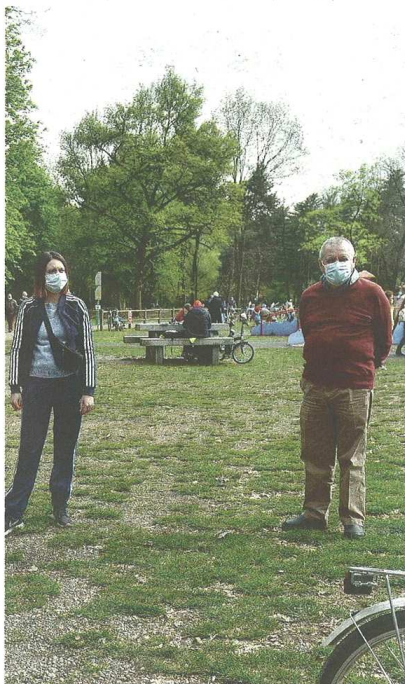
Parco Alto Milanese, un polmone verde da rilanciare