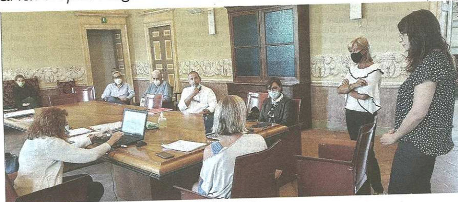
Nei giorni scorsi si è riunito il tavolo tecnico con i rappresentanti dei Comuni per affrontare la questione miasmi