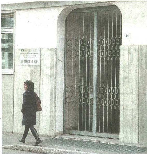
Il distretto socio sanitario non è attivo come un tempo, occorre rivolgersi a Busto Arsizio ma alcuni servizi sono attivati in città