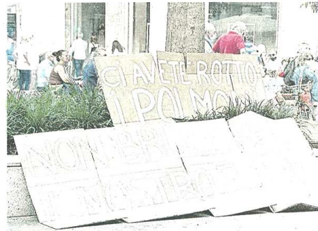
Una manifestazione del comitato "pro chiusura" in centro a Legnano