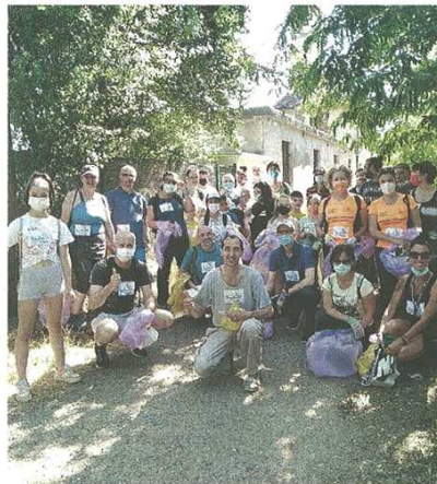
I componenti dell'associazione Casaringhio Aps

pubblicato il 24/06/2021 a pag. 28; autore: Stefano Di Maria