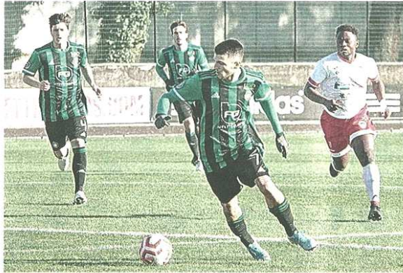
I neroverdi scaldano i motori in vista delle gare dei playoff