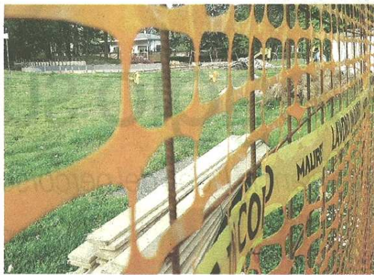
Le reti di cantiere delimitano l'area del Parco Cantoni dove gli interventi di riqualificazione sono ormai in deciso ritardo

do addosso all'azienda affinché acceleri».