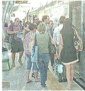
La stazione di Castellanza