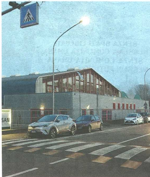
22mila euro per il 2021 e 30mila per il 2022 sono le sovvenzioni da erogare a Castellanza Servizi per l'uso del PalaBorsani e della palestra Leonardo Da Vinci (Blitz)

Le sovvenzioni, per l'anno corrente 22mila euro e per il 2022 30mila, sono un costo da erogare a Castellanza Servizi Patrimonio per l'uso del PalaBorsani e della palestra Leonardo Da Vinci. Obiettivo: favorire la diffusione della pratica sportiva sul territorio comunale. Il tutto considerato l'anno di pandemia, «a seguito del perdurare della situazione di rischio sanitario, con le misure restrittive per il contrasto del contagio proro-