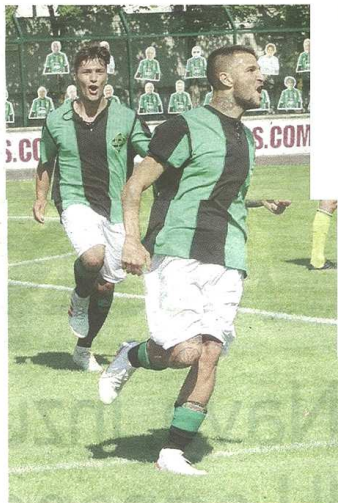
Chessa esulta dopo aver firmato il calcio di rigore (sotto), 31° gol stagionale (Notteovare Castellanzese / ALDO MASSARUTTO)

I gol di Chessa, Colombo e Corti celebrano al meglio una splendida maglia old style