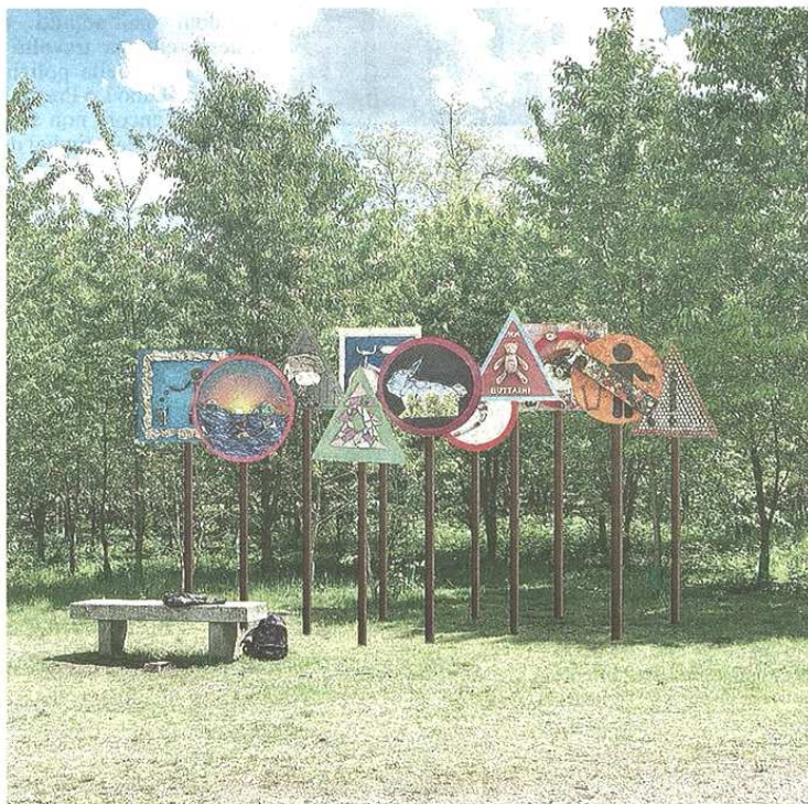
Iniziativa artistica di Legambiente con alcuni studenti

pubblicato il 05/06/2021 a pag. 27; autore: Carlo Colombo