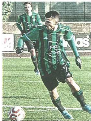
La finale contro Pont Donnaz chiusa 5-1

pubblicato il 29/06/2021 a pag. 17; autore: Cristiano Comelli