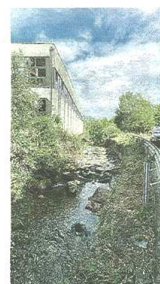
Le sorgenti dell'Olonà alla Rasa, un tratto del fiume in versione bucolica poco dopo le sorgenti e in via Peschiera. Più si va a sud e più il fiume è inquinato

pubblicato il 06/07/2021 a pag. 16; autore: Barbara Zanetti