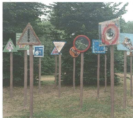
L'installazione realizzata dall'artista Enrico Cazzaniga (Bizz)

Stefano Di Maria © RIPRODUZIONE RISERVATA