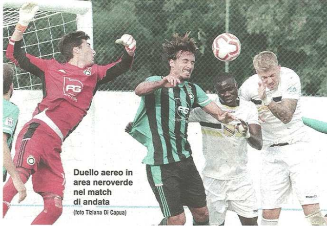
Duello aereo in area neroverde nel match di andata

Castellanzese lanciattissima: 34 punti su 39 nelle 13 gare giocate nel 2021, nel mirino la settima vittoria consecutiva. Con tante certezze, ed un dubbio che verrà sciolto solo prima del fischio d'inizio: il top scorer della quarta serie Mario