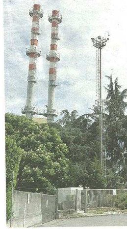
Un piano di rilancio ancora non è pronto. Riunione entro il 20 marzo

Il cerchio acceso resta ora in mano a Legnano. Che chiede certezze sull'uso dei terreni di Borsano almeno per 25 anni. Antonelli non si sente di vincolare un'area importante senza alcuna certezza sull'utilizzo futuro. L'attrito rimane. Quello che è chiaro è che, senza un piano di salvataggio, Accam fallirà il 31 marzo. Per questo il vincolo è di convocare una nuova assemblea dei soci entro il 20. L'atto votato chiede di perseguire il risanamento della società con il sostegno di Amga e Agesp, aperti alla partecipazione