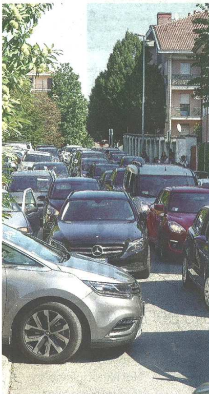
Il traffico vicino alla scuola Maria Ausiliatrice (Eliz)

CASTELLANZA Caos fuori da scuola, sindaco furioso