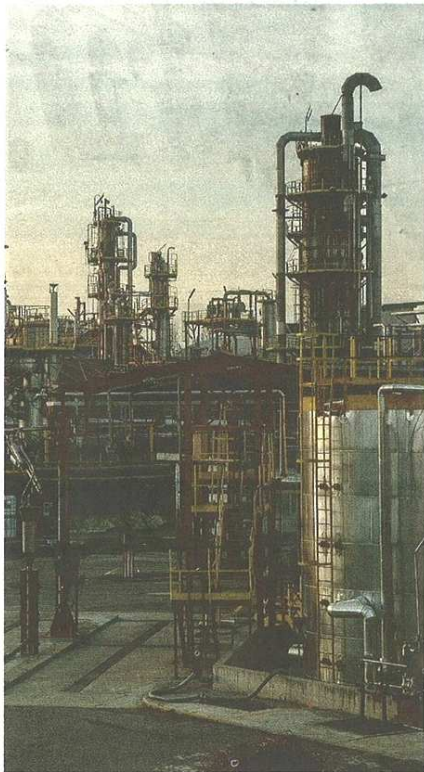
La costruzione del nuovo impianto prevede oneri che aiuteranno il Comune a migliorare alcuni spazi (Bilz)

CASTELLANZA Campi da bocce e luci nei parchi