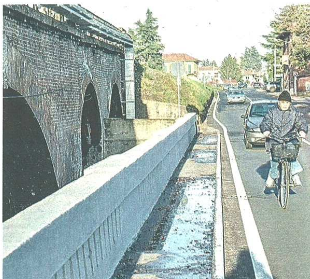
Il rafforzamento del principale ponte di Castellanza è una priorità

pubblicato il 20/11/2021 a pag. 9; autore: Rosalba Reggio