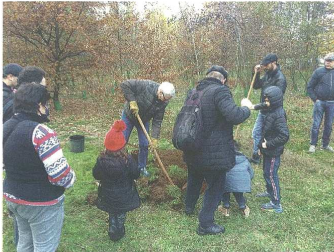
Il gruppo che ieri ha onorato la festa dell'albero con alcune piantumazioni

pubblicato il 21/11/2021 a pag. 28; autore: Carlo Colombo