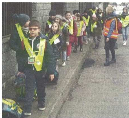
Il servizio era un successo in tempi pre Covid, da domani si riparte con attenzione alle mascherine

Da domani si riparte con 225 alunni iscritti e 50 genitori a fare da capotreno