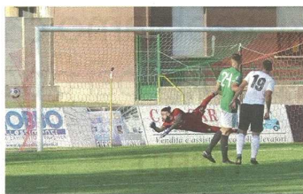
Cincilla è battuto dai bolide di Cavagna (a sinistra la sua scatenata esultanza) e per la Castellanzese è la terza sconfitta consecutiva, la quarta in cinque partite