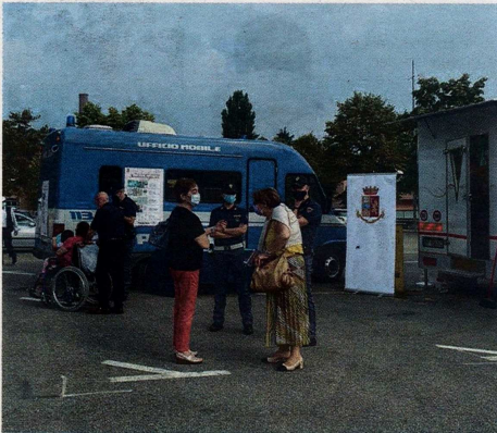
Due immagini dell'iniziativa di ieri mattina al mercato di Castellanza, dove gli agenti della Polizia di Stato hanno incontrato i cittadini

CASTELLANZA Ufficio mobile della Questura al mercato: consigli, racconti e applausi