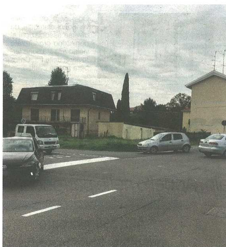
I residenti della zona fanno appello all'amministrazione comunale perché trovi una soluzione: all'incrocio tra le vie Piave e Lombardia pare si corra davvero troppo e i castellanzesi sono preoccupati (Gila)

Stefano Di Maria © RIPRODUZIONE RISERVATA